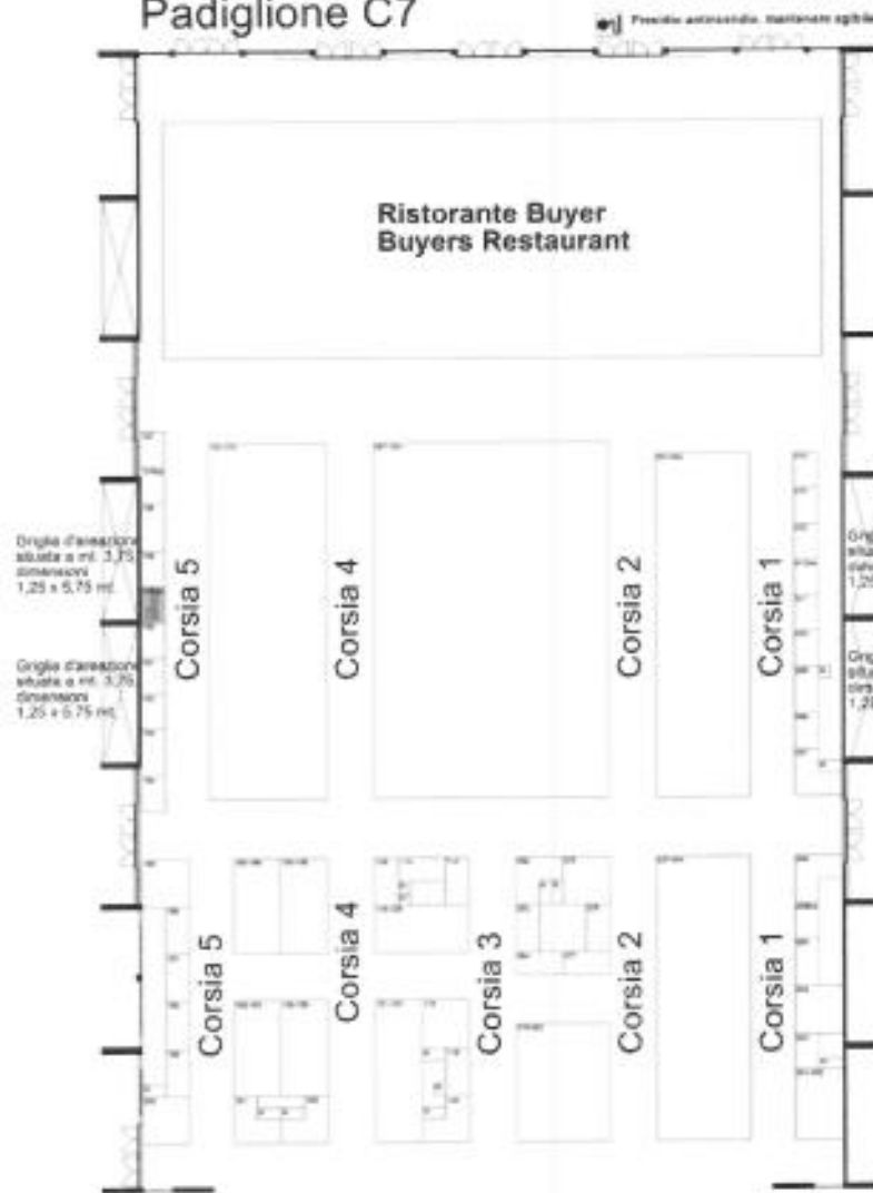
Quartiere Rimini Fiera S.p.A.